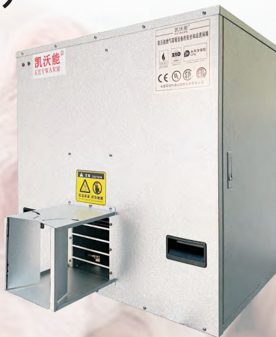
负压燃烧直燃式暖风机 (KWDHVS)