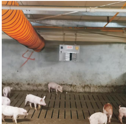
丰县立华师寨猪场