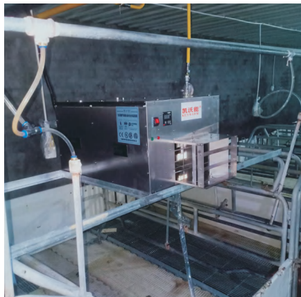
连云港立华下车猪场