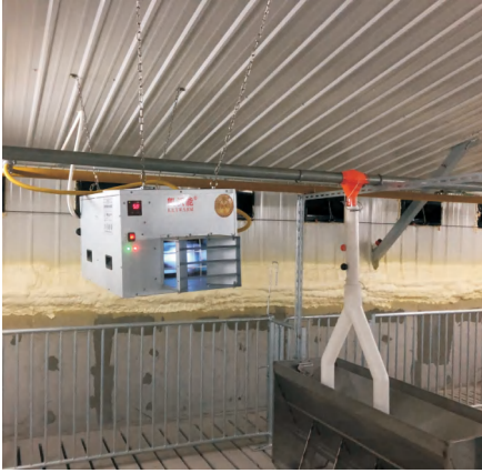
傲农集团大创猪场