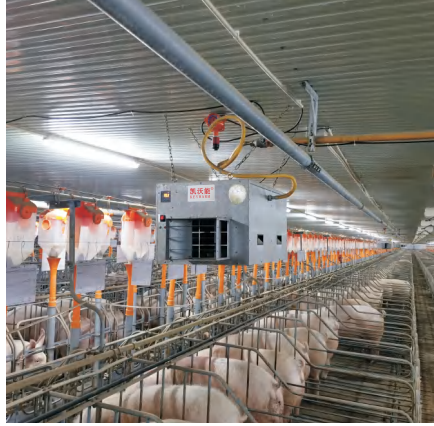
德康集团泗洪猪场