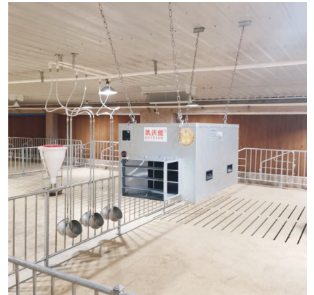
贵州首信杠寨村猪场