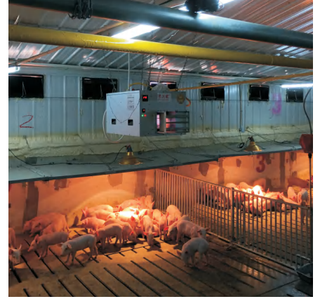
石羊集团马庄猪场