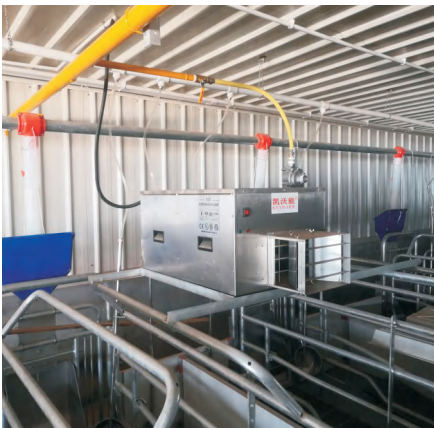
石羊集团南社猪场