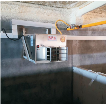
石羊集团岱堡猪场