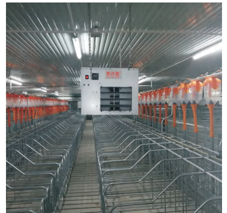
德康集团石集猪场