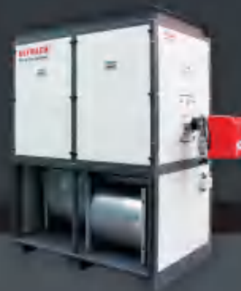
卧式机技术参数表